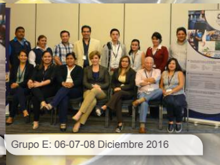
Grupo E: 06-07-08 Diciembre 2016