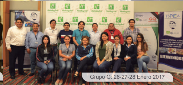
Grupo G: 26-27-28 Enero 2017

La nueva regulación de la US FDA, la CFR 117 - Buenas Prácticas de Manufactura y Análisis de Peligros y Controles Preventivos basados en el Riesgo para Alimentos de Consumo Humano (HARPC), buscan asegurar la inocuidad de los productos alimenticios que se consumen en los Estados Unidos. Esta regulación, que entrará en vigencia el 17 de septiembre de este año, exige que algunas actividades que realizan las empresas que elaboran/procesan, empacan o almacenan alimentos, sean ejecutadas o supervisadas por un "individuo calificado en controles preventivos" (PCQI).