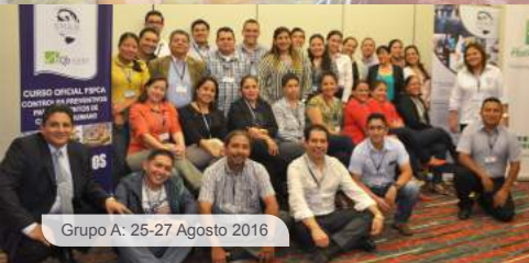
Grupo A: 25-27 Agosto 2016