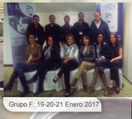
Grupo F: 19-20-21 Enero 2017