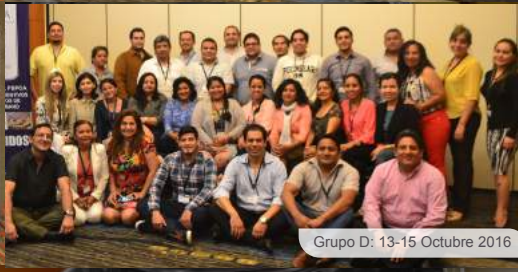
Grupo D: 13-15 Octubre 2016