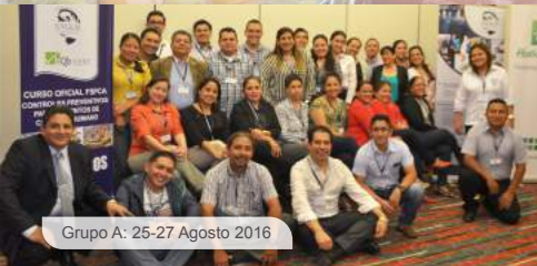
Grupo A: 25-27 Agosto 2016