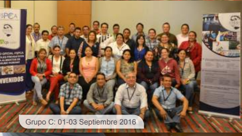
Grupo C: 01-03 Septiembre 2016