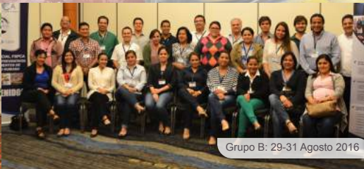
Grupo B: 29-31 Agosto 2016