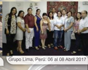
Grupo Lima, Perú: 06 al 08 Abril 2017