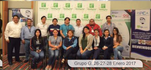
Grupo G: 26-27-28 Enero 2017

La nueva regulación de la US FDA, la CFR 117 - Buenas Prácticas de Manufactura y Análisis de Peligros y Controles Preventivos basados en el Riesgo para Alimentos de Consumo Humano (HARPC), buscan asegurar la inocuidad de los productos alimenticios que se consumen en los Estados Unidos. Esta regulación, que entrará en vigencia el 17 de septiembre de este año, exige que algunas actividades que realizan las empresas que elaboran/procesan, empacan o almacenan alimentos, sean ejecutadas o supervisadas por un "individuo calificado en controles preventivos" (PCQI).