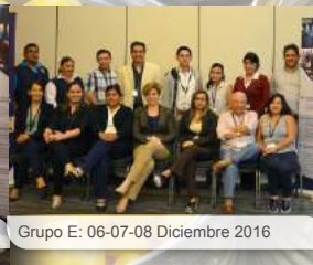
Grupo E: 06-07-08 Diciembre 2016